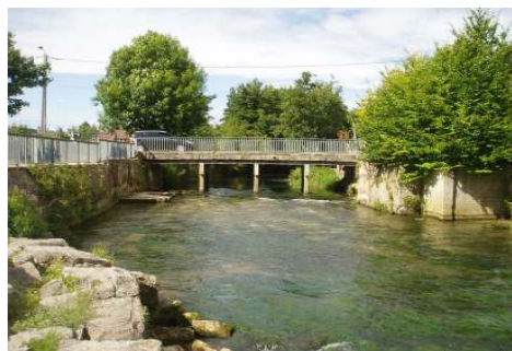
Ouvrage avant et après travaux